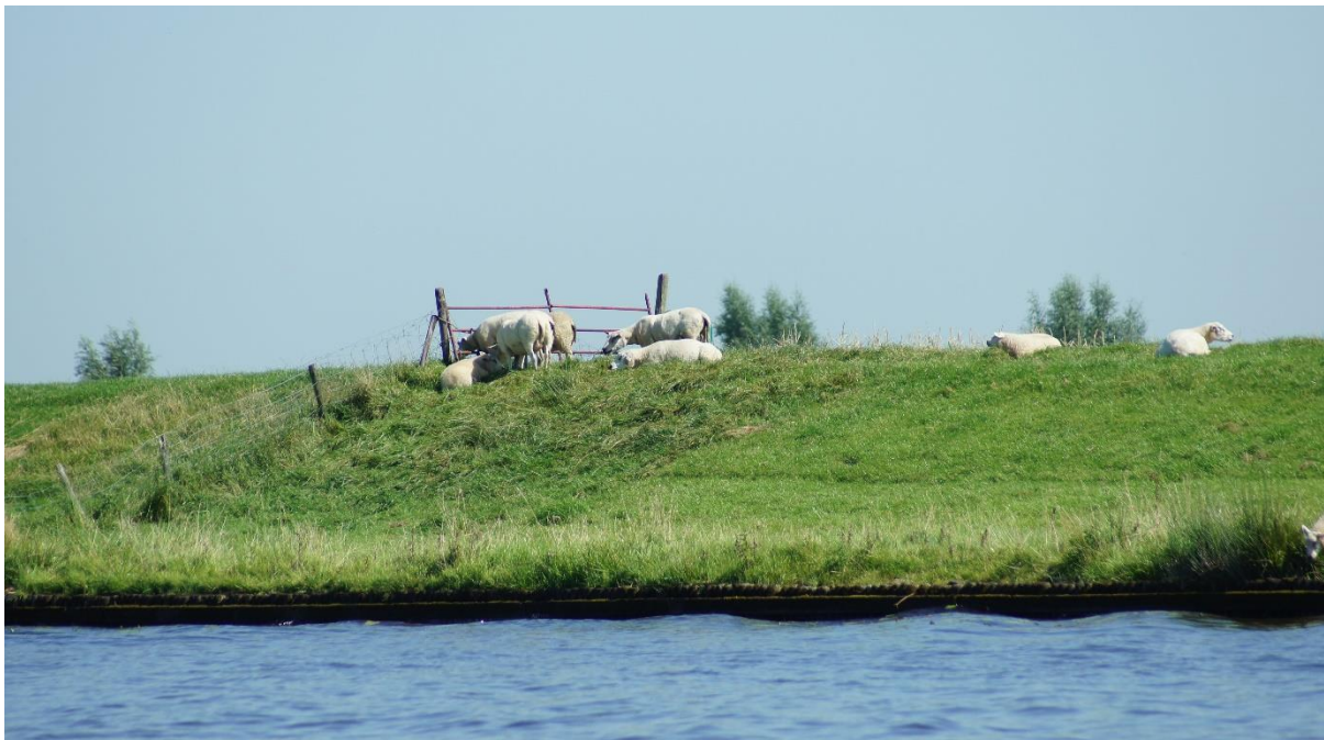
De dijk langs de Goot / Ganzendiep

Als watersportverbond juichen we de ecologische upgradering in beginsel toe. Uitgangspunt voor ons blijft dat de bevaarbaarheid en de veiligheid gewaarborgd moeten blijven. Ook zien wij koppelkansen, zoals dat in het jargon heet, tussen de projectopgave Natura 2000, de Kaderrichtlijn Water en het onderhoud aan het Ganzendiep en de Goot