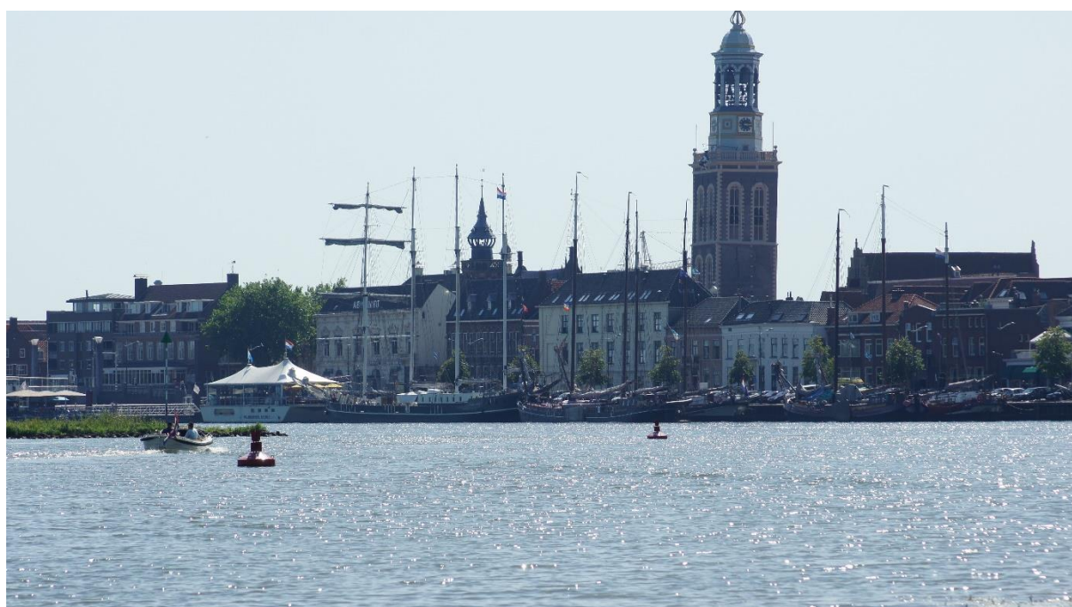
Het Ganzendiep mondt uit in de IJssel.

De afgelopen maanden is er natuurlijk van alles gebeurd. In dit zomerbericht doen we daar beknopt verslag van. Roept het bericht vragen op, bel of mail dan even. Het snelst krijg je antwoord als je het volgende email adres gebruikt: j.v.esseveld@planet.nl