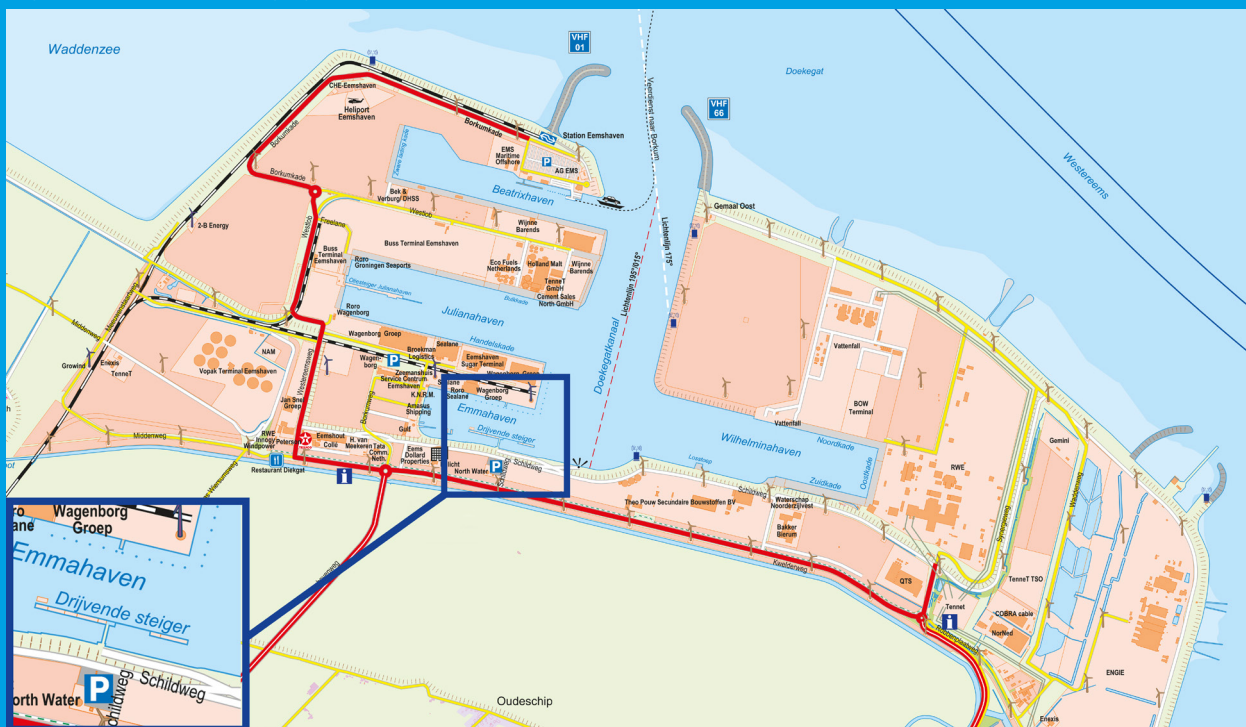
Overzicht Eemshaven - Niet voor navigatie doeleinden!

Als u toestemming heeft om de Eemshaven binnen te komen, dan zal u in principe een ligplaats worden toegewezen aan de drijvende steiger in de Emmahaven. Deze steiger ligt geregeld vol en een aantal plekken zijn verhuurd. Dit kan betekenen dat u eventueel langs een ander schip moet afmeren. Volg de aanwijzingen die eventueel gegeven worden op.