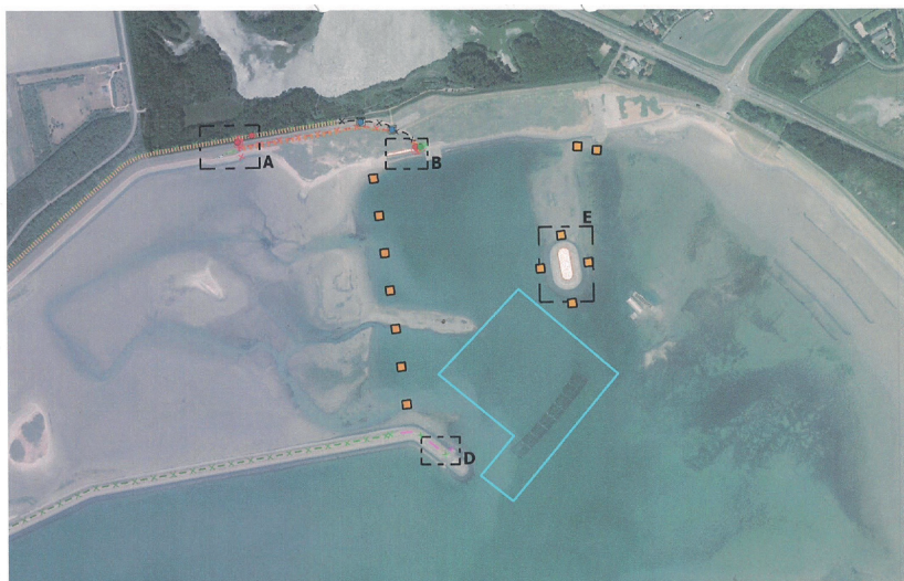
Nieuwe werktekening Schelphoek 5 augustus 2021

Midden in de vakantieperiode werden we opgeschrikt door plannen van Staatsbosbeheer om de toegang tot de ankerbaai in de Schelphoek te verbieden. Een bezwaarschrift bij de gemeente Schouwen-Duiveland leidde tot een geprek met provincie Zeeland en Staatsbosbeheer. Zeldzaam: al na tien dagen was de kwestie opgelost. Een nieuwe grens is getrokken, waarbij de ankerbaai bruikbaar blijft.